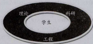
图1 “理论—科研—工程”三位一体教学模式 国家内河航道整治工程研究中心以国家课题支

根据现代教育理念,单一理论知识的讲解,学生学习起来较枯燥乏味,且教学效果不佳,如果以多种方式从多种途径让学生围绕这些知识点展开学习,将会达到较好的效果 [6] 。