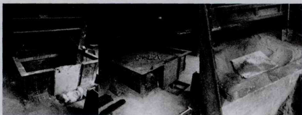
图3 土工模型试验槽

根据笔者多年的教学经验,在理论学习的过程中,将理论与实践结合效果甚佳。复合地基处理技术在实际工程中应用很多,根据教学大纲的安排,将课堂教学与工程实践结合,根据工程中心承接项目和正在开展的工程项目,带领学生到项目部和施工现场观摩,并参与项目技术人员的工作。学生根据工地的实际情况和项目部提供的工程地质水文等资